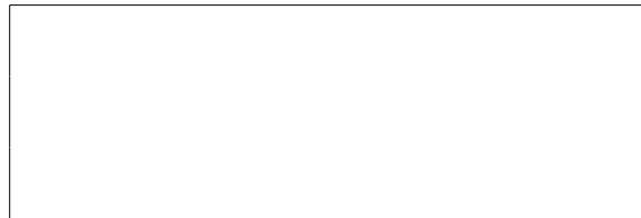
Схема границ эксплуатационной ответственности сторон

Прочие сведения по установлению границ раздела эксплуатационной ответственности сторон _____